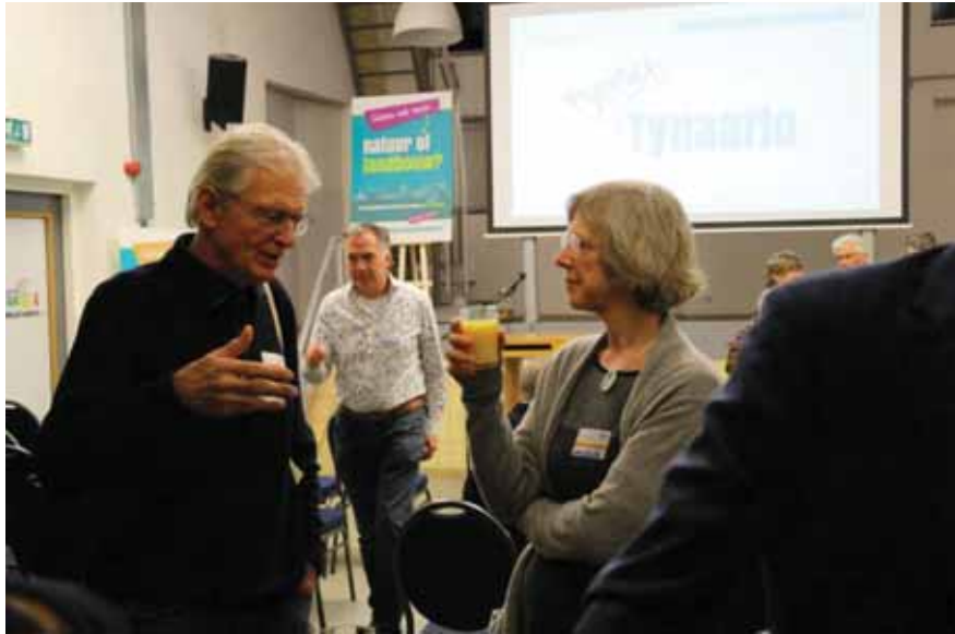
We sluiten de dag af met een borrel