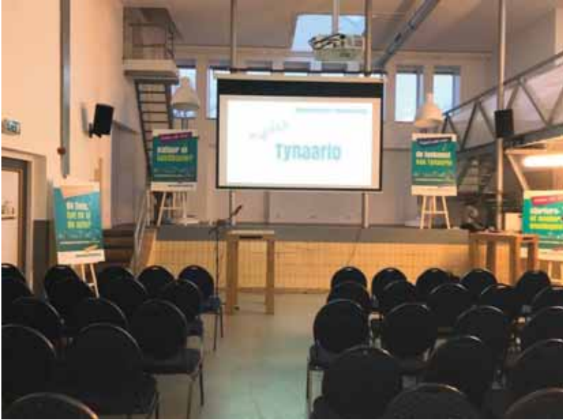
De Melkfabriek in Bunne