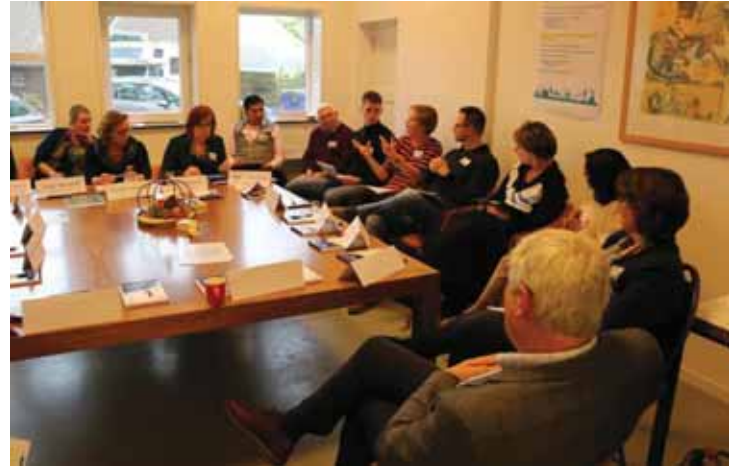
De aanwezigen gaan in groepjes uiteen om over verschillende onderwerpen uit de omgevingsvisie te praten