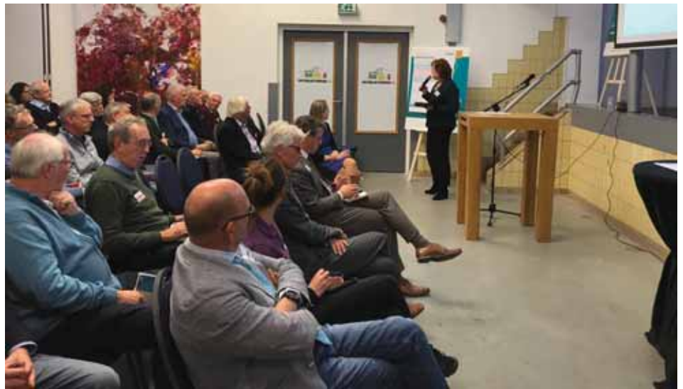
Na de workshops is er een plenaire terugkoppeling